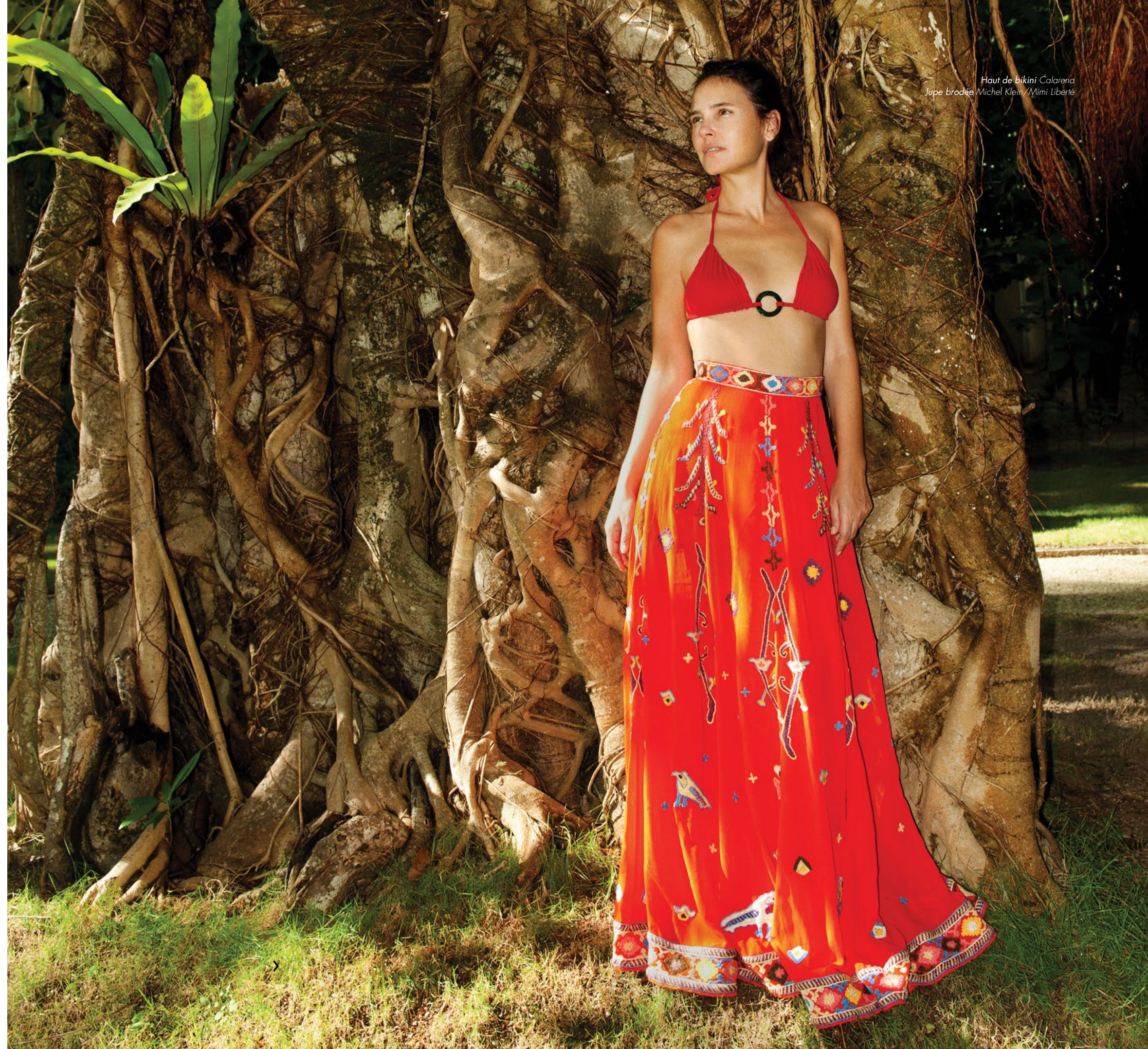
Haut de bikini Calarena Jupe brodée Michel Klein / Mimi Liberté

V.L. Lorsque je tournais au Liban, j'ai par exemple été invitée à dîner chez les parents des acteurs libanais avec qui je tournais. Dans ce pays, cela signifie quelque chose. Le repas était succulent. Il ›