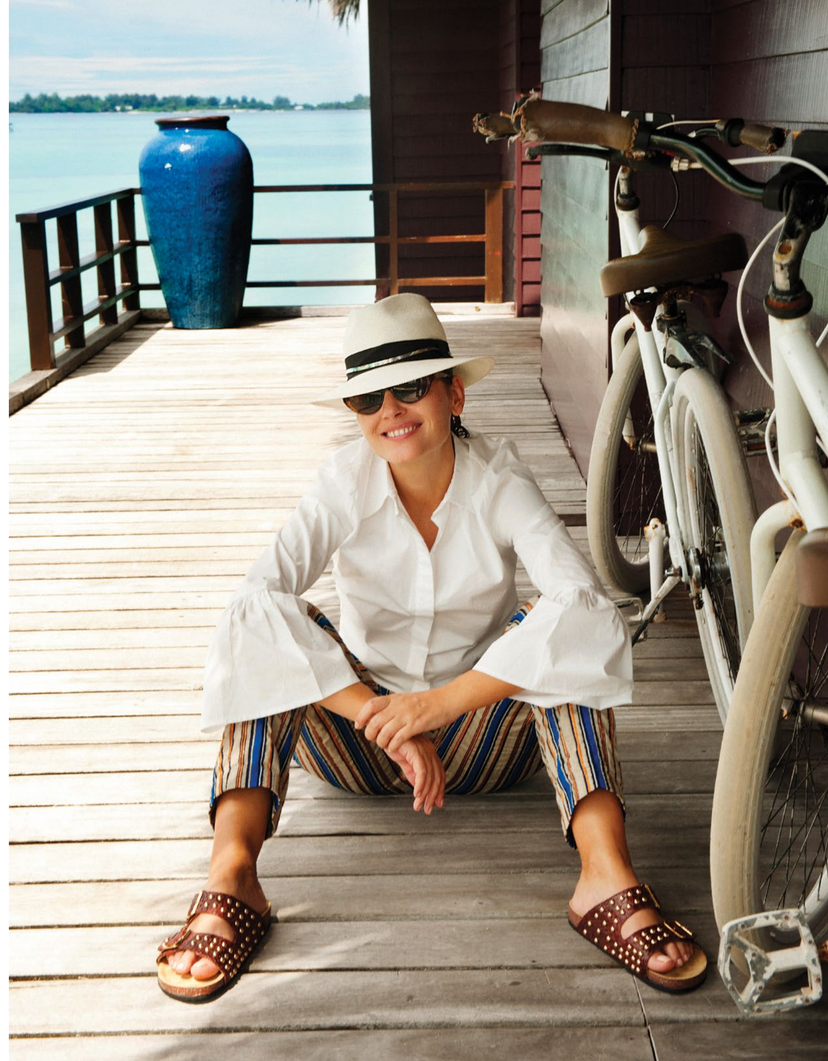
À droite : Chapeau Laurence Bossion Pantalon rayé Forte Forte Chemise blanche Charlise Sandales Claris Viot